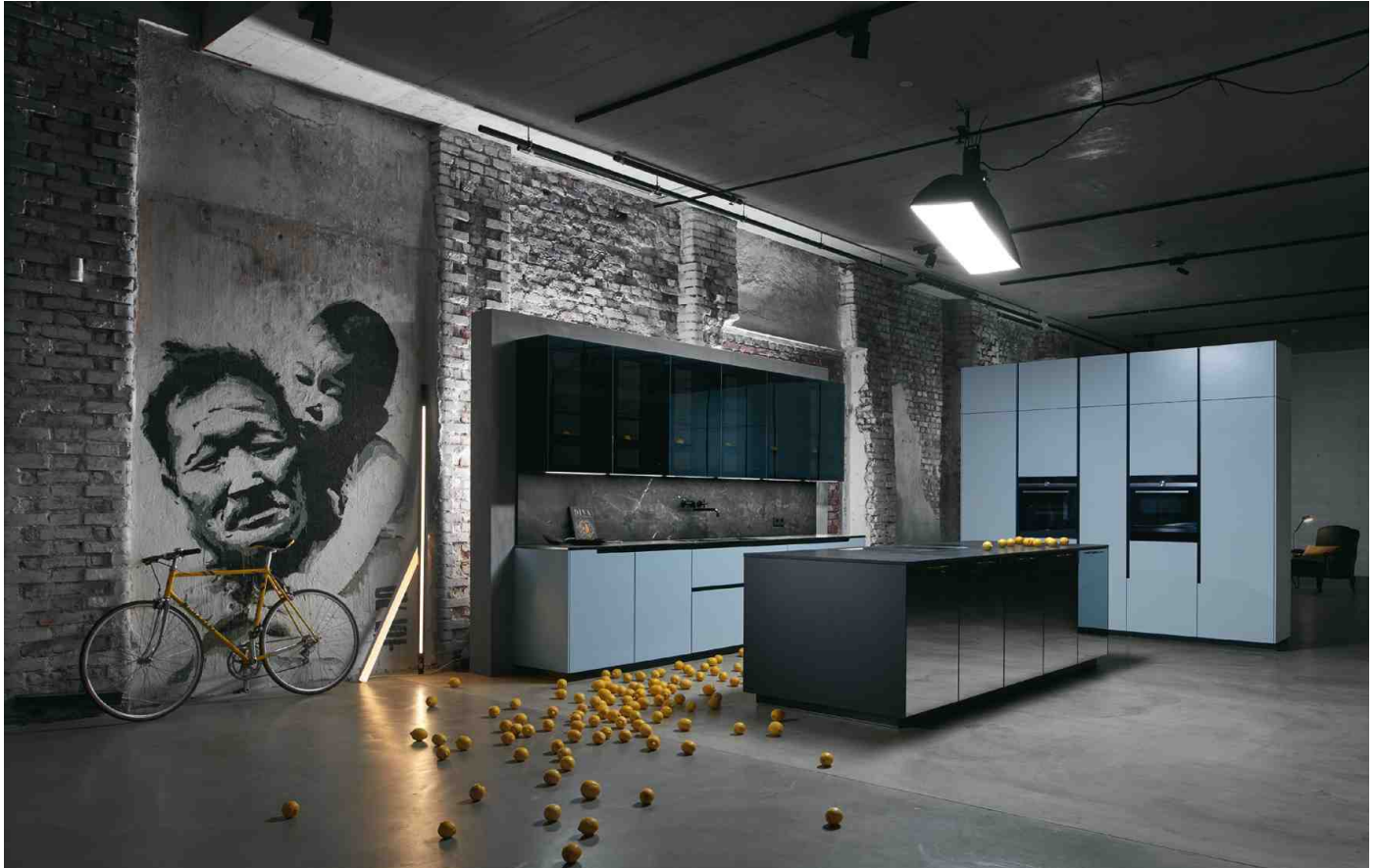
Die INTUO Designküchen setzen auf hochwertiges und modernes Design: oben die Designküche Reflekto, unten die Designküche Impreso.

INTUO: neu und exklusiv. Edle Küchenarchitektur mit vier Neuheiten.