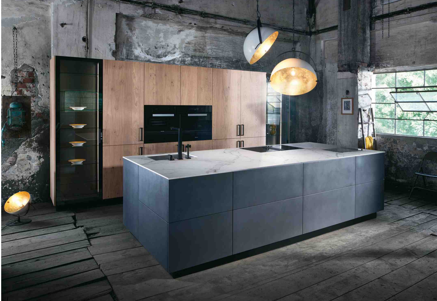
Oben: Die Designküche Fero greift den Trend zu Grau auf, unten ebenso die Designküche Nubo.

der neuen „Fero“ zog die Blicke auf sich. In Kombination mit Hochschränken in „white oak“ setzt sie klare Akzente. Denn das Küchendesign spielt auf elegante Weise mit Kontrasten und industriellen Farbtönen. Auch die Neuvorstellung „Reflektó“ spiegelt diesen Ansatz wider. Schwarzes reflektierendes Dekorglas bereitet der Küche einen glänzenden Auftritt, den die bemerkenswerten Hoch- und Unterschränke in der außergewöhnlichen Trendfarbe „matcha latte“ wirkungsvoll betonen.