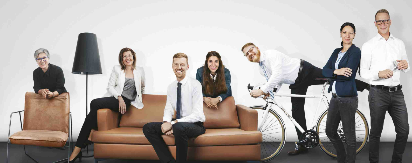
Die Abteilung Schulung bei Häcker Küchen.