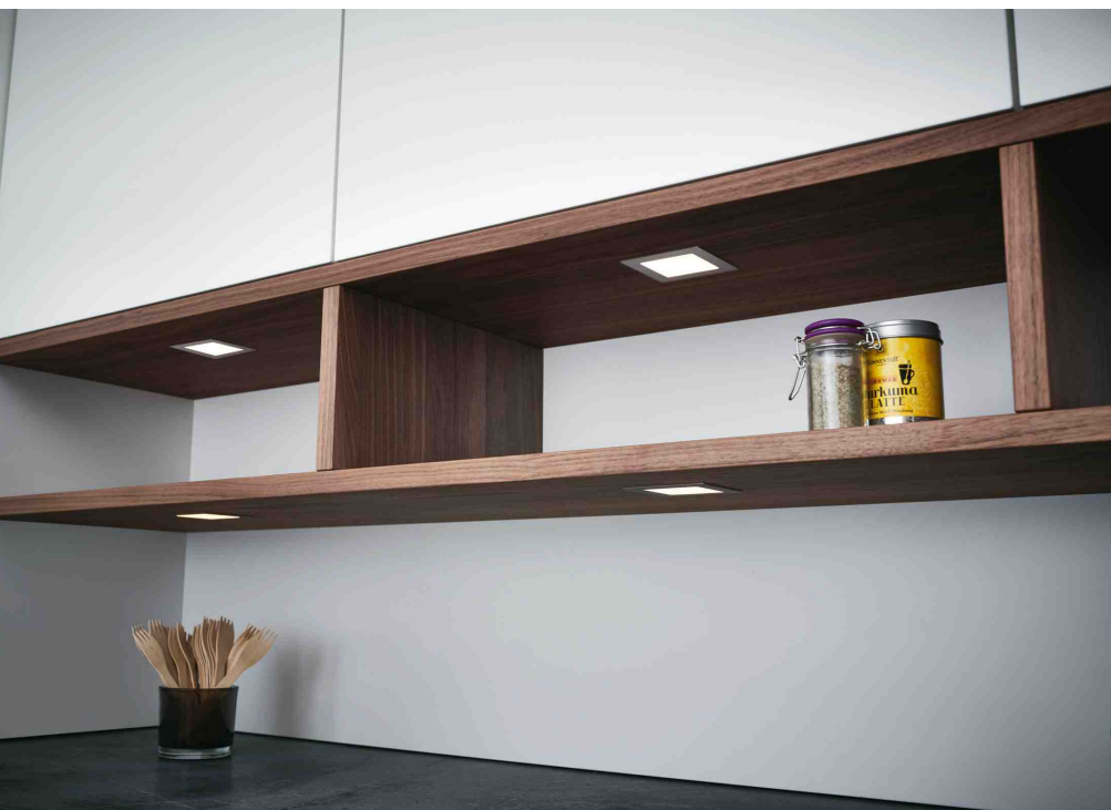
Schönes Gestaltungselement: Quadratische LED-Strahler.

Seit längerem existieren in der Küchenwelt Leuchtsysteme, die über das normale Licht hinausgehen. Die Küche ist nicht nur ein Ort, der eine Funktion hat, sondern an dem auch kreativ gearbeitet wird. Das Licht sollte dementsprechend angepasst sein. Es muss die Arbeitsprozesse fördern. Der österreichische Hersteller ewe bietet daher eine spezielle Lichtsteuerung an. Damit lassen sich per Fernbedienung Temperatur und Helligkeit des Lichtes bestimmen. Praktischerweise ist dies auch via App auf dem Smartphone möglich. So kann das Licht an jede Situation angepasst werden. Warmes, gedimmtes Licht schafft eine gemütliche Atmosphäre, die perfekt zu geselligen Abenden mit Freunden passt. Es sind jene Abende, an denen sich die Küche in eine Bar verwandelt. Das kühle Licht ist wiederum perfekt, um die Vorbereitungen dafür zu erledigen. Helles, kühles Licht unterstützt den Kochprozess. Man behält alles im Überblick und erkennt den Zustand der Lebensmittel besser.