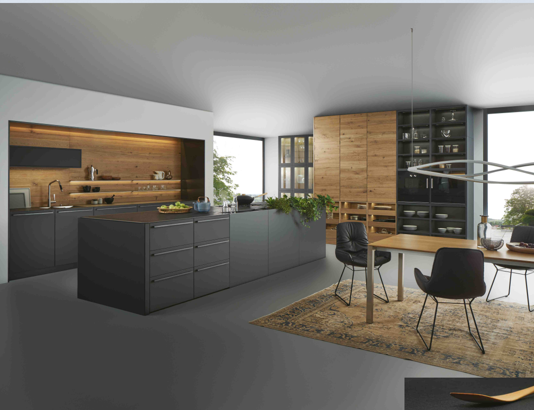
Bild links: Ermöglicht eine Küchenplanung auf höchstem Niveau: Die Erhöhung der Frontlinie um 15 Millimeter. Optisch „taucht“ die Arbeitsplatte in die Fronterhöhung ein und zeigt eine nur 5 Millimeter starke, sichtbare Kante aus edlem Carbonglimmer. Dieses Gesamtpaket erzeugt eine puristische und elegante Optik. Die im Rahmen von EVO planbaren Arbeitsplatten bestehen aus Schichtstoff oder Quarzwerkstoff und sind grundsätzlich 20 Millimeter stark. Arbeitsplatte, Kante und Griff sind in gleicher Farbe gehalten.

Bild unten: Äußerst filigran wirkt die Gestaltungslinie EVO und wird erstmals mit dem Küchenprogramm Valais I Bondi gezeigt. Die dünne Arbeitsplattenkante bildet mit den erhöhten Fronten und ebenfalls konsequent in Carbongrau gehaltenen Griffen ein harmonisches Gesamtbild.